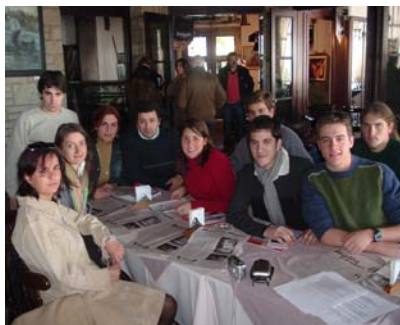
Los jóvenes de la AGIM reunidos con miembros de la delegación pugliesa