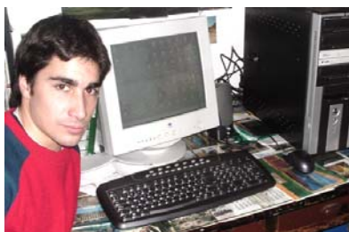
El Presidente de la AGIM con la computadora donada por el Comitato Tricolore per gli italiani nel Mondo

ROMA - Rinnovo del 389 contrattisti, in servizio presso i Consolati, che si occupano dell'aggiornamento delle liste e delle procedure elettorali, affinché possano continuare l'operazione di allineamento dell'AIRE e dell'Anagrafe consolare; utilizzo di quest'ultima per le prossime elezioni politiche del 2006: è quanto ha chiesto il Ministro per gli Italiani nel mondo Mirko Tremaglia rivolgendosi ai 140 capi missioni intervenuto alla cena offerta dal Ministro degli Esteri Franco Frattini a Villa Madama in occasione della Conferenza degli Ambasciatori. Tremaglia, che aveva partecipato in mattinata ai lavori della Conferenza, ha poi sottolineato il ruolo fondamentale degli Italiani all'estero, oggi finalmente riconosciuto dal voto, nonché il peso anche economico di questi connazionali a lungo dimenticati. Non a caso Tremaglia ha ricordato la neonata Confederazione degli Imprenditori italiani nel mondo, presieduta da Giuseppe Zamberletti.