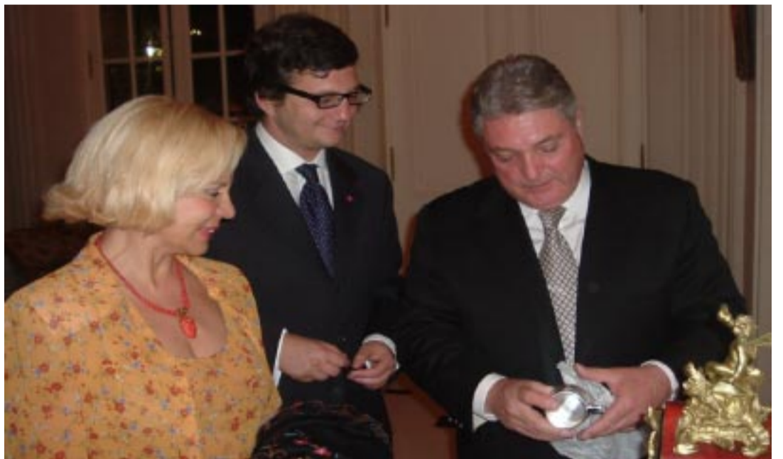
El Vicepresidente del Consiglio Comunale de Roma junto al Embajador Nigido en su residencia