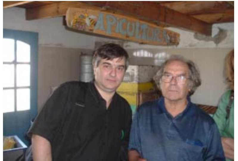
La Prima Voce junto al Premio Nobel de la Paz Adolfo Perez Esquivel en el taller de Apicultura de las Aldeas «Los niños por la Paz»