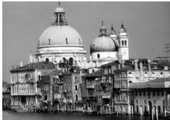
VENEZIA. Canal Grande e Chiesa di S. Maria della Salute