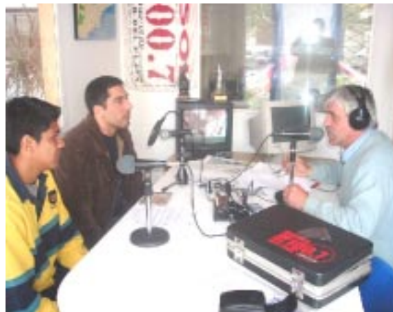
La gioventù friulana informando sull'organizzazione del Festival

"Il nostro genere si può definire etnico balcanico (zone montuose dalla Bosnia alla Grecia e costa dalmata) in versione rock. Cantiamo in lingua croata, sloveno e dialetto sloveno. Suoniamo anche in versione acustica. I temi musicali sono duettati da chitarra elettri-